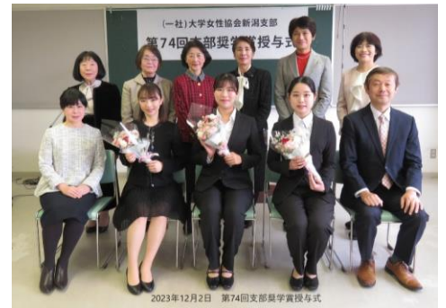
支部奨学賞論文「ジェンダー平等社会実現のためにすべきこと」審査により採用された受賞者とともに

新潟県女性センターと新潟県女性財団の設立にあたっては設立発起人の一員となり、団体会員として女性の地位の向上に努め協働しています。女性の教育が社会を良くすることを強く信じ、女性がみな自分らしさを大切に生きる社会づくりに貢献できるよう、次代を見据えた活動をこれからも続けます。