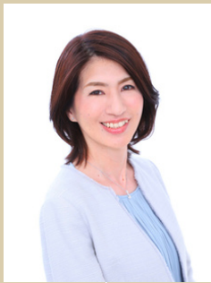
2/1(木) 林田 香織さん wonderLife代表 (オンラインで登壇します)