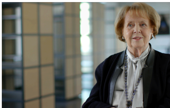
配給元 : kinologue