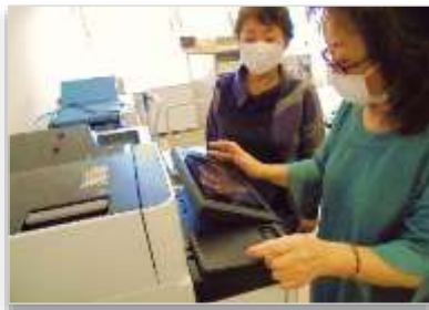
操作が簡単！と好評です。