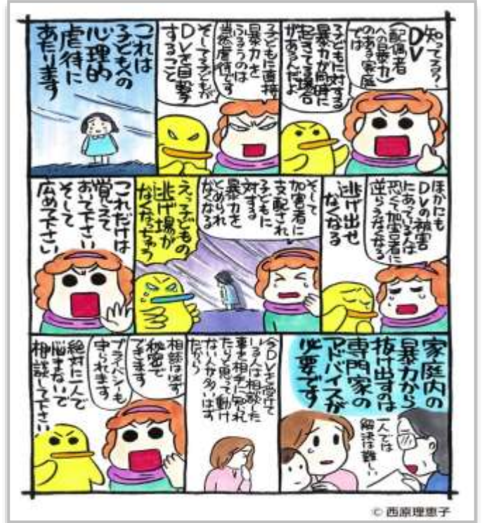
「内閣府男女共同参画局 女性に対する暴力をなくす運動の描きおろし漫画」